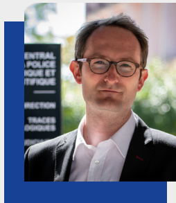
Pierre PASCAUD, commissaire de police